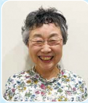
ながく ぼ あやこ

上三川町では、多くの方がボランティア等の地域福祉活動を行っています。日々活動をしている方にインタビューを行いました。