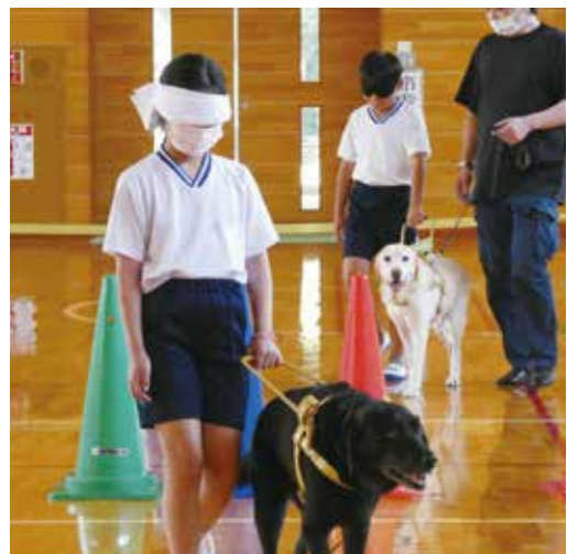
福祉教育(盲導犬講座)