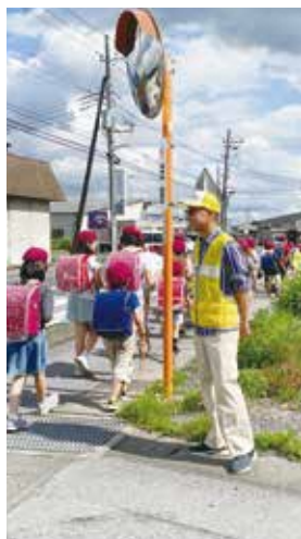
地域の安全見守り隊