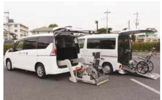
福祉車両貸出事業