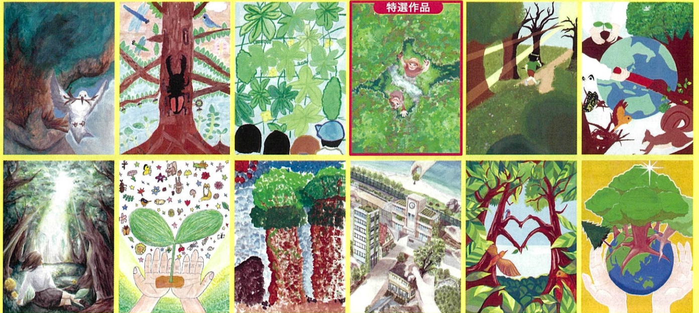
令和8年用国土緑化運動・育樹運動ポスター原画コンクール栃木県推薦作品

※随時、寄附者名と寄附額を下野新聞に掲載します。 ※高額の寄附者には顕彰の制度があります。