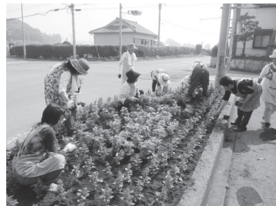
プランターに花を植える 多功下坪自治会