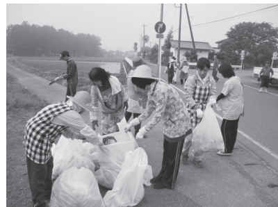
東蓼沼東自治会での環境美化運動

5月29日、町内各所で多くの方が参加し、町をきれいにする統一美化キャンペーンが行われました。環境美化運動では主要道路などに捨てられている空き缶などのごみが回収され、花いっぱい運動では、各自治会の皆さんが町内の主要な通りなどにサルビア、マリーゴールドなどを植えました。