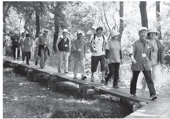
新緑の中を歩きました

磯川緑地公園等では、新緑の中マイナスイオンを浴びながら楽しく歩くことが出来ました。